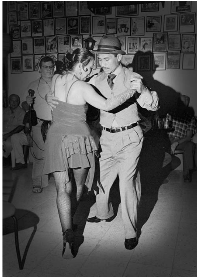
Otrora el tango, hoy el tango y el despecho continúa...