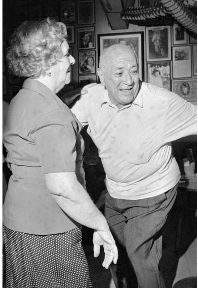
Bailo con la velocidad de los tiempos presentes, gozo con el olvido de los tiempos futuros, abrazo con la fuerza de los tiempos pretéritos...