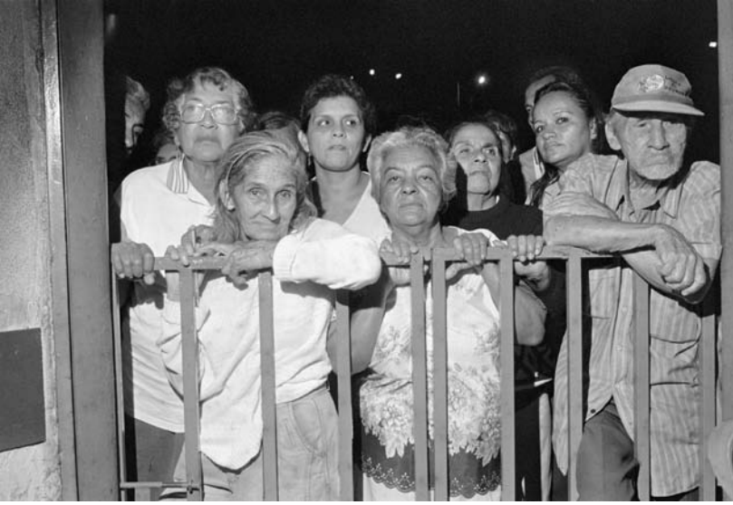
El umbral, una tribuna para observadores de bohemia y arrabal...

del Barrio San Antonio y la ciudad de Cali, Colombia, inmediatamente inicia el periodo de la industrialización y urbanización y del rescate de la memoria de sus protagonistas.